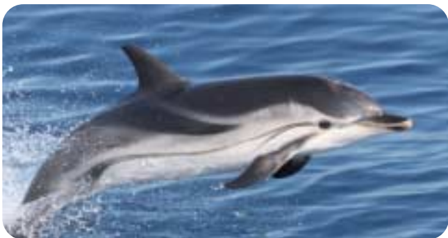
Sail & Whale

Sali a bordo con noi. Il mare ha tante storie da raccontare e un gran bisogno di amici che lo sappiano rispettare e difendere.